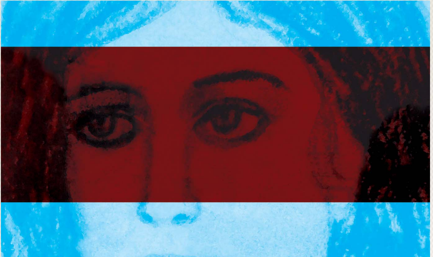
Έργο του Ν. Σέλελη

τικο-οικονομική κρίση υπάρχει ο κίνδυνος να παραμεληθεί η μεταρρύθμιση ή οι δομές να υπολειπώσουν, χωρίς τα αναγκαία μέσα ή την ποιότητα των υπηρεσιών. Παρόλο που αυτός είναι ένας κίνδυνος, εγώ αισιοδοξώ ότι η Πολιτεία δεν θα αθετήσει τις δεσμεύσεις της απέναντι στην Ε.Ε. Εμείς από την άλλη χρειάζεται να κρατήσουμε την ποιότητα στις υπηρεσίες μας και να οργανώσουμε τις δράσεις μας ώστε και την Πολιτεία να πιέσουμε, αλλά και να προτείνουμε τρόπους να πιάει η μεταρρύθμιση προς τη σωστή κατεύθυνση.