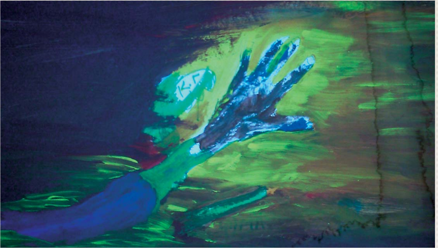
Έργο του Κ. Γαλάτη

που ήδη υπάρχουν, έχουν δημιουργήσει μια εξαιρετικά δύσκολη κατάσταση στην παροχή υπηρεσιών ψυχικής υγείας (ράντζα στις ψυχιατρικές κλινικές, υπολειτουργία των κλινικών στις περιφέρειες, έλλειψη εξειδικευμένου προσωπικού, παραβίαση των δικαιωμάτων των ψυχικά ασθενών, κίνδυνος όσον αφορά τη βιωσιμότητα των δομών που δημιουργήθηκαν στα πλαίσια του προγράμματος Ψυχαργώς). Η ματαιώση του έργου που έχει συντελεστεί από τις δομές του Ψυχαργώς, και το οποίο δεν αφορούσε απλά στη βελτίωση των συνθηκών νοσηλείας των ασθενών, αλλά στην ουσιαστική αποασυλοποίηση και επανένταξή τους στον κοινωνικό περίγυρο, είναι πλέον ορατή. Και ενώ διαφαίνεται ο κίνδυνος κατάρρευσης του συστήματος ψυχικής υγείας, αυξάνονται, λόγω της οικονομικής κρίσης, οι ανάγκες των πολιτών για ψυχολογική υποστήριξη. Ο φόβος για το αύριο, το φάσμα της ανεργίας, η υποβάθμιση της ποιότητας ζωής δοκιμάζουν τα όρια των ανθρώπων, με αποτέλεσμα την αύξηση των επισκέψεων των πολιτών στα εξωτερικά ιατρεία των μεγάλων ψυχιατρικών περίπου κατά 50% τους πρώτους μήνες του 2010, σε σύγκριση με το πρώτο τρίμηνο του 2009.