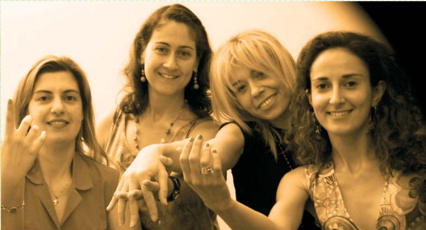
Εργαζόμενες της Ε.Κ.Ψ.& Ψ.Υ. σε στιγμιότυπο από τις πρόβες της παράστασης "Όνειρο Θερινής Νυκτός"

ναισθηματικός δεσμός με ασθενή), ο εθελοντής θα πρέπει να προαναγγείλει και να προετοιμάσει την αποχώρησή του τουλάχιστον δύο μήνες πριν.