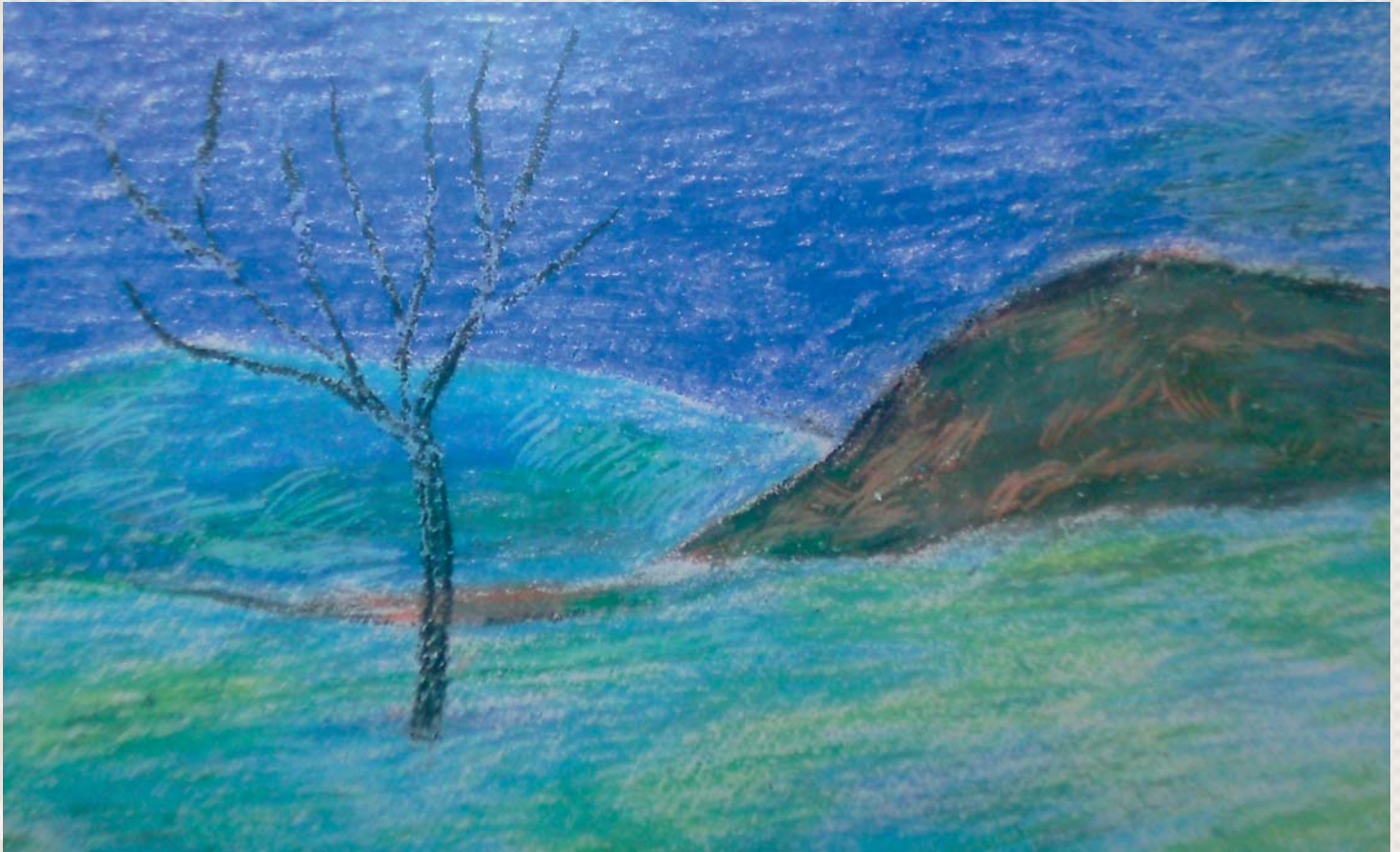
Έργο του Ν. Σέλιου