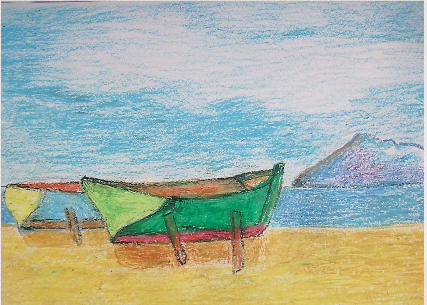
Έργο του Ν. Σέλελη

κλήρωση της τομεοποίησης, όπου οι μονάδες ψυχικής υγείας δεν θα είναι αυτόνομες και αυτοπροσδιοριζόμενες αλλά θα υπάρχει ενιαία διοίκηση με δυνατότητα λήψης αποφάσεων και σχεδιασμού για όλο τον τομέα, μπορεί να οδηγήσει στη σωστή αξιοποίηση του προσωπικού. Η ανάληψη της ευθύνης ενός ψυχιατρικού αρρώστου από μια θεραπευτική ομάδα που θα τον παρακολουθεί σε όλες τις φάσεις της αρρώστιας του, ενισχύει την θεραπευτική σχέση, συμβάλει στη μείωση των υποτροπών, στην κοινωνική του επανένταξη και σε μια καλύτερη ποιότητα ζωής. Η θεσμοθέτηση της αξιοποίησης εμπειρών στελεχών στη δια βίου εκπαίδευση στις μονάδες ψυχικής υγείας και στην εποπτεία περιστατικών πιστεύω ότι μπορεί να συμβάλει σε μια καλύτερη οργάνωση και απόδοση των υπηρεσιών ψυχικής υγείας χωρίς μεγάλο οικονομικό κόστος.