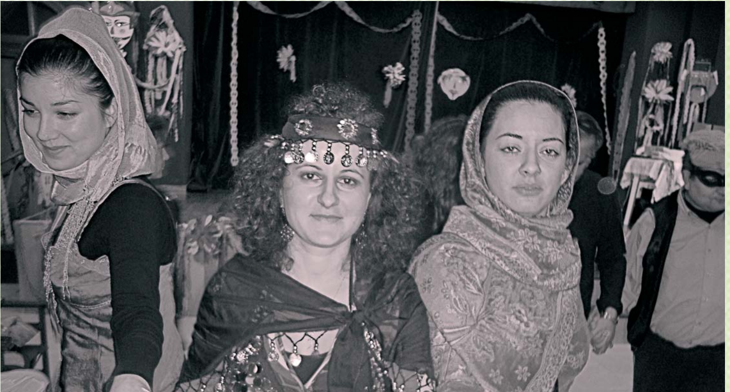
Στιγμιότυπο από την αποκριάτικη γιορτή της Δομής Αττικής.

κατάστασης (οικοτροφεία, ξενώνες, διαμερίσματα, κέντρο ημέρας, πρόγραμμα προ και επαγγελματικής κατάρτισης κ.α.). Ως μέλη της θεραπευτικής ομάδας ενισχύονται στην εξοικείωση με ψυχοθεραπευτικούς χειρισμούς και στην καλλιέργεια συναισθηματικής σχέσης με τους ψυχωσικούς ασθενείς και τις οικογένειές τους. Επίσης, εξοικειώνονται με την αντιμετώπιση οξέων περιστατικών και υποτροπών, την περίθαλψη στο σπίτι του ασθενή, το follow-up και την εργασία με την οικογένεια του αρρώστου.