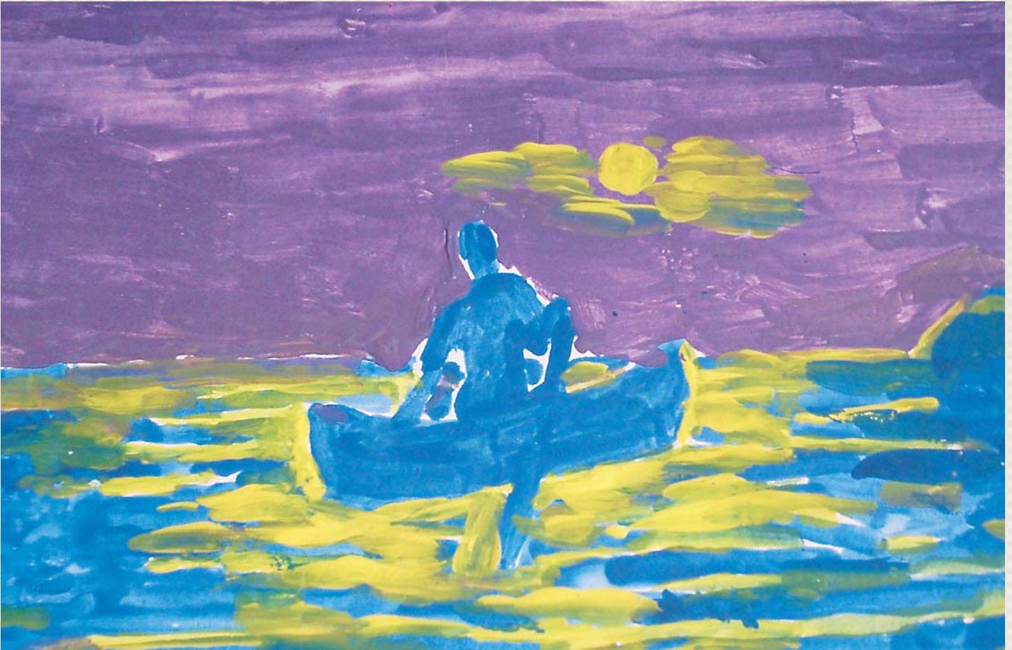
Έργο του Ν. Σέλελη

πιστημίου. Θα χρειαστούν περίπου 10 ώρες μαθημάτων, ταχύρρυθμα όμως.