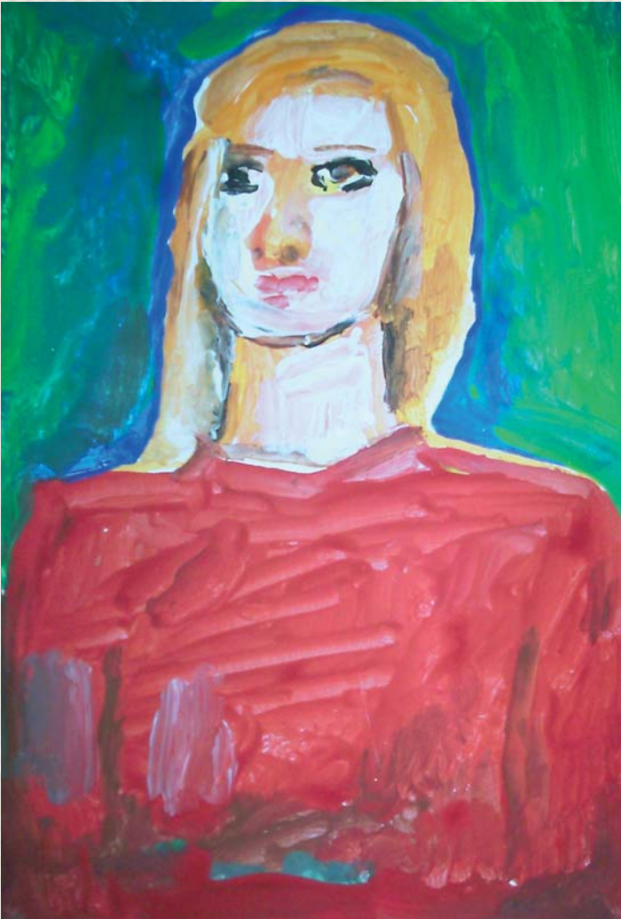
Έργο του Ν. Σέλελη