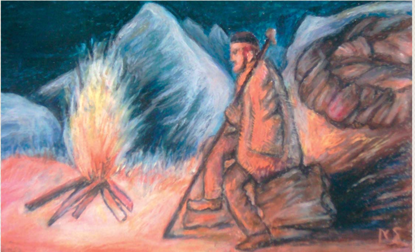
Έργο του Ν. Σέλιου