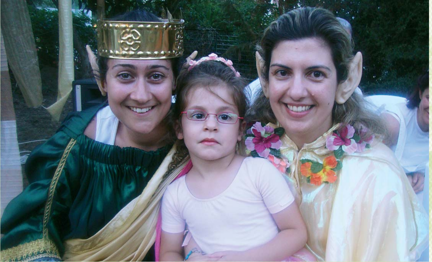
Στιγμιότυπο από την καλοκαιρινή γιορτή της δομής Αττικής "Όνειρο Θερινής Νυκτός".

δευόμενους φοιτητές αλλά και μεταπτυχιακούς φοιτητές κάθε χρόνο, υποστηρίζονται οργανωμένα μέχρι και 10 εθελοντές, μέγεθος που καθορίζεται κάθε φορά από τον αριθμό του διαθέσιμου προσωπικού για την εκπαίδευση και υποστήριξη τρίτων, αλλά και τις λοιπές δυνατότητες του Φορέα.