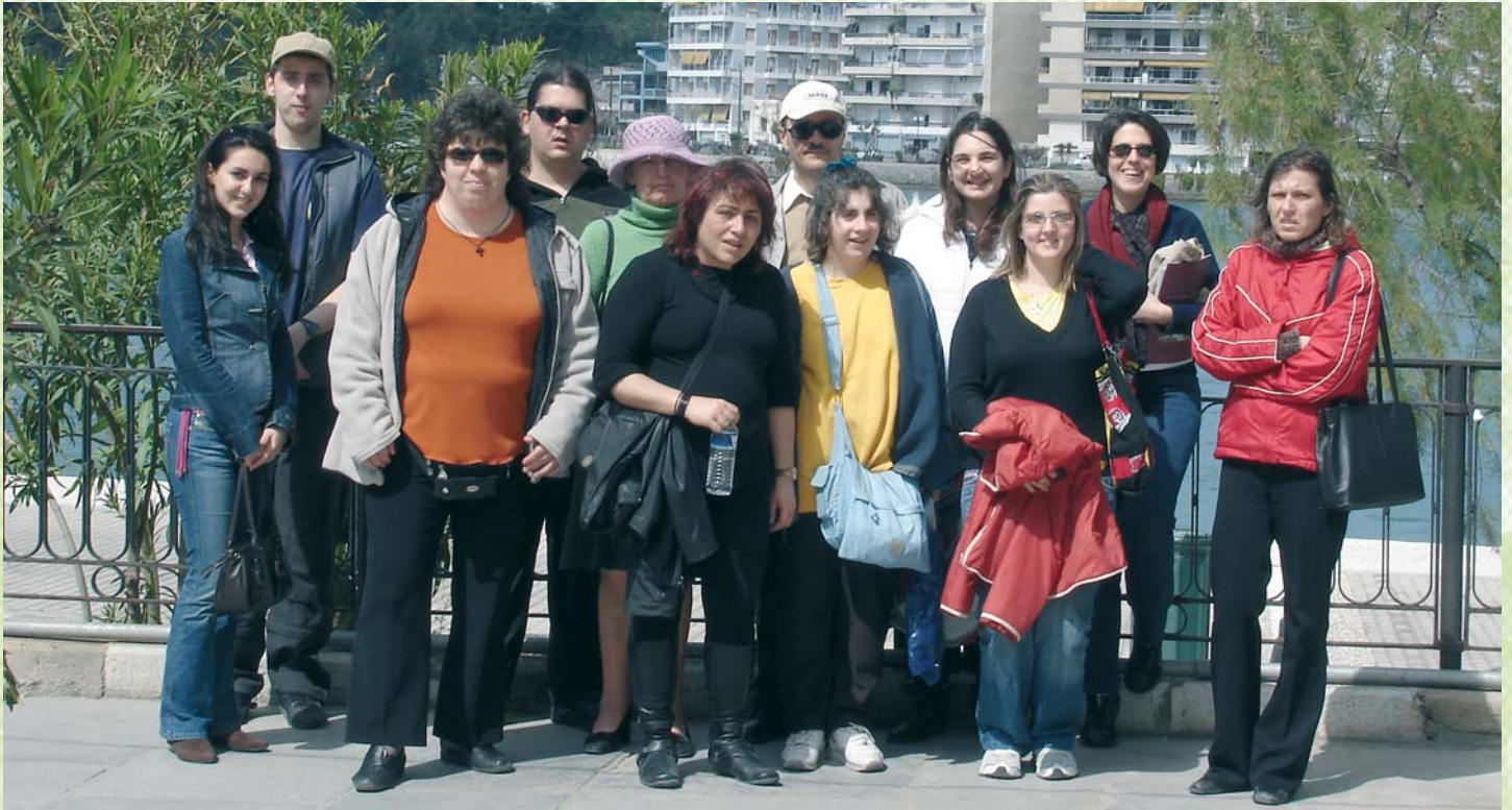
Εκδρομή με το πρόγραμμα κοινωνικοποίησης

Οι εθελοντές προσέρχονται με δική τους πρωτοβουλία, εκφράζοντας το αίτημα για προσφορά εθελοντικής εργασίας. Αρχικά, κάποιος ενημερώνεται αναλυτικά για τη δομή, την οργάνωση και τη λειτουργία του Φορέα (η εξοικείωση με τη λειτουργία του Φορέα αποτελεί βασικό παράγοντα, για να κινείται άνετα στο χώρο) και καλείται να γνωριστεί και να συζητήσει με τα στελέχη ψυχικής υγείας. Οι προκαταρκτικές αυτές συζητήσεις- συνεντεύξεις έχουν σκοπό την αλληλογνωριμία, την εξοικείωση του εθελοντή με το χώρο και τις ανάγκες των ατόμων με ψυχική διαταραχή. Ο εθελοντής μπορεί με αυτόν τον τρόπο να εκτιμήσει και ο ίδιος εάν οι δικές του προσδοκίες, επιθυμίες και δυνατότητες μπορούν να συνδυαστούν με τα δεδομένα του Φορέα και τις ανάγκες των ατόμων με ψυχική διαταραχή. Ο εθελοντής εκτιμά επίσης εάν μπορεί να αντεπεξέλθει σε ενδεχόμενες υποχρεώσεις και δεσμεύσεις. Παράλληλα, δίνεται η δυνατότητα στους επαγγελματίες, να εκτιμήσουν τις δεξιότητες και τα ενδιαφέροντά του.