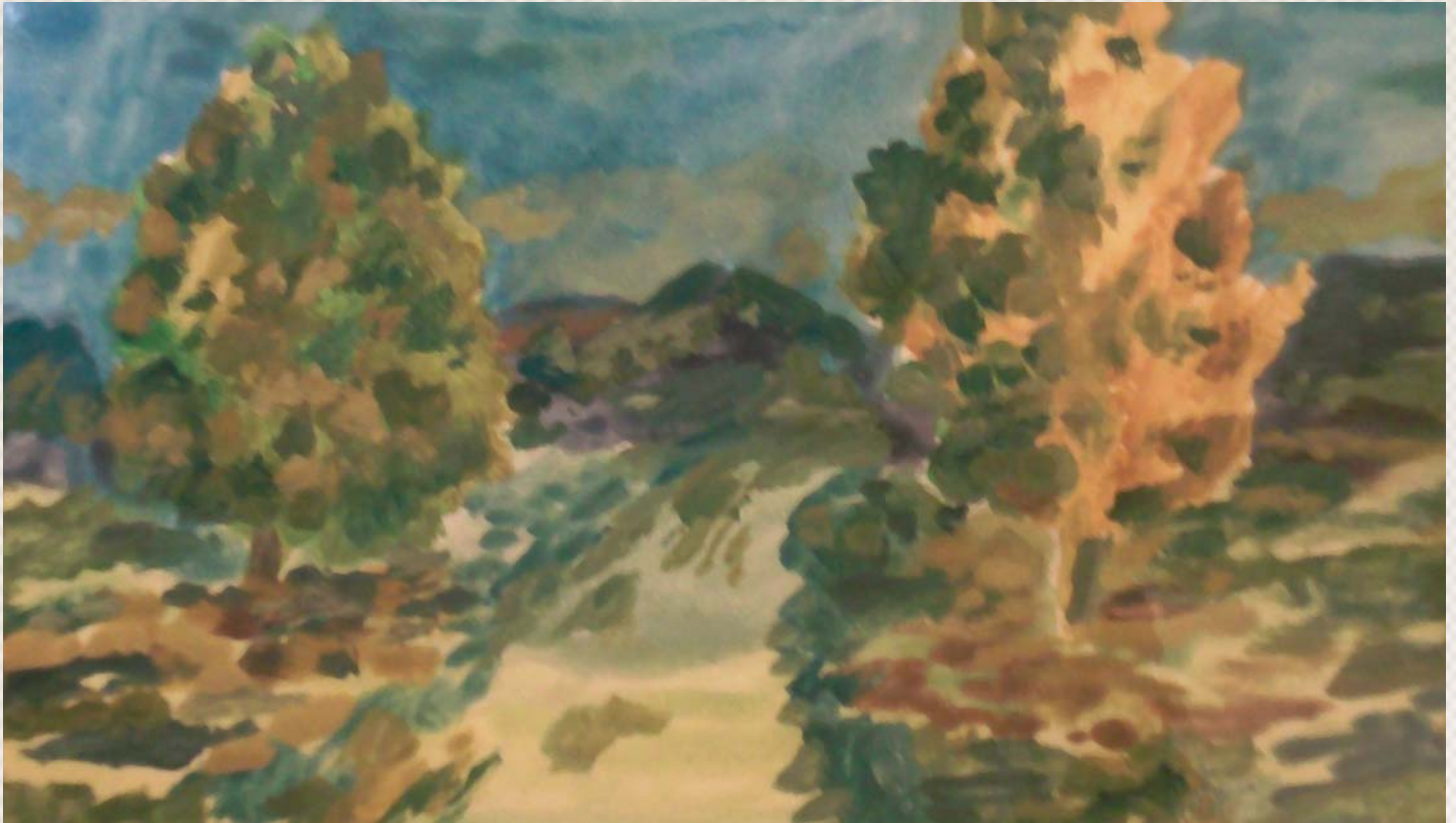
Έργο του Ν. Σέλεη

3. Οι επαγγελματίες της ψυχικής υγείας έχουν ευθύνη να φροντίσουν μια από τις πλέον αδύναμες κατηγορίες εκτοπισμένων ανθρώπων. Οι επαγγελματίες της ψυχικής υγείας έχουν ευθύνη να μην επιτρέψουν να εκτοπιστούν και άλλοι. Οι επαγγελματίες της ψυχικής υγείας έχουν ευθύνη να κρατήσουν τα μάτια τους ανοιχτά πέραν του μερικού πλαισίου που εργάζονται για να αλλάξουν κάτι και στο έδαφος που πατούν όλα τα πλαίσια. Οι άνθρωποι της ψυχικής υγείας μακάρι να βρουν αντοχή και διάθεση να συνδράμουν να μη γίνει η κρίση υστερία. Οι άνθρωποι της ψυχικής υγείας σε αυτή την ιστορική συγκυρία μπορούν να αντλήσουν μόνο από τα δικά τους αποθέματα. Οι αρχές της μεταρρύθμισης, ο κοινωνικός της προσανατολισμός, η ανθρωπιστική επιστημονική τους εκπαίδευση, η "ηθική" τους θέση στα δρώμενα είναι τα σημαντικά, τα ακριβά και τα ελάχιστα τα οποία θα πρέπει να αντιτάξουν στον κυνισμό και την απαξίωση του κόπου τους, στην περιφρόνηση της υγείας των ασθενών τους, της υγείας και του μέλλοντος ολονών. Η ύπαρξη έστω και ενός φορέα, έστω και ενός λειτουργού της ψυχικής υγείας που θα αντέξει στην γλυκιά νάρκωση του μηδενισμού και της αδιαφορίας μπορεί να αποτελέσει σπόρο αρκετό για να αναδειχθεί εκ των υστέρων η σημασία της προσπάθειας.